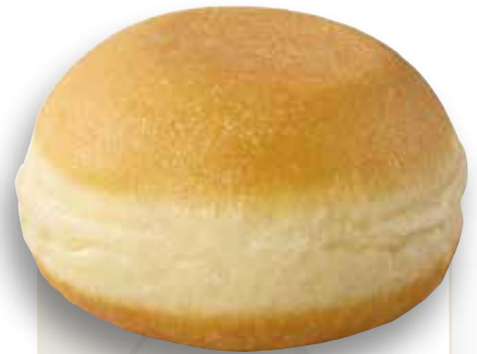
Berliner mit Füllung ohne Dekor