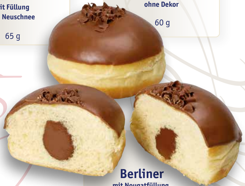
Berliner mit Nougatfüllung, Glasur und Schokolocken