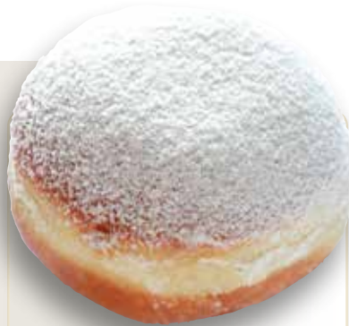
Berliner mit Füllung und Neuschnee