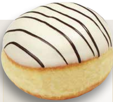
Berliner mit Füllung und Fettglasur